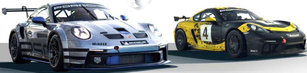
■ Carrera Cup ■ Trophy ■ Challenge SC Porsche Mobil 1 Supercup